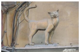
Кошка Василиса прогуливается по карнизу дома на Малой Садовой улице.

В Петербурге на улицах города можно встретить много памятников кошкам. Это дань уважения тысячам животных, погибших в страшные 900 дней блокады Ленинграда.