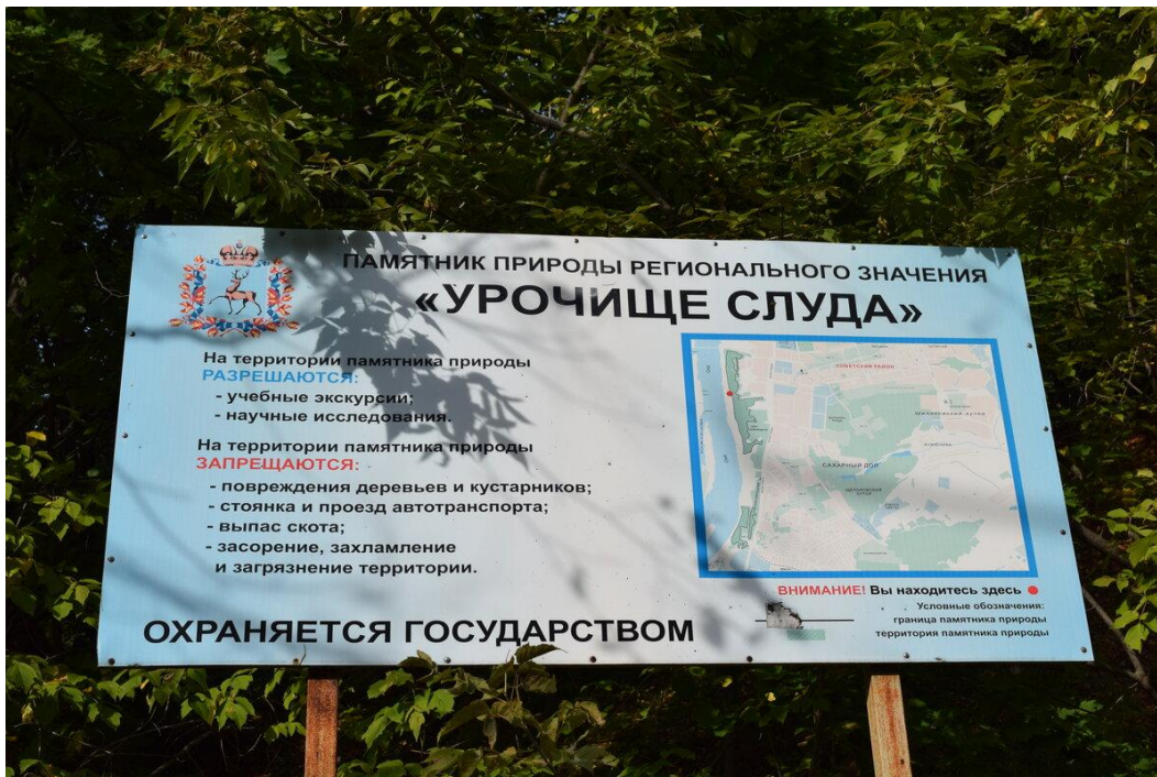
Урочище Слуда в парке "Швейцария" в Нижнем Новгороде.