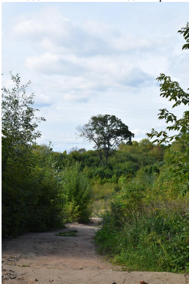
Необычное дерево в парке, чем-то напомнило пейзаж саванны.

Назад мы поднимались примерно минут 30 с короткими остановками. По пути нам встретилось только пара человек, зато на верхней смотровой площадке было много людей с фотоаппаратами.