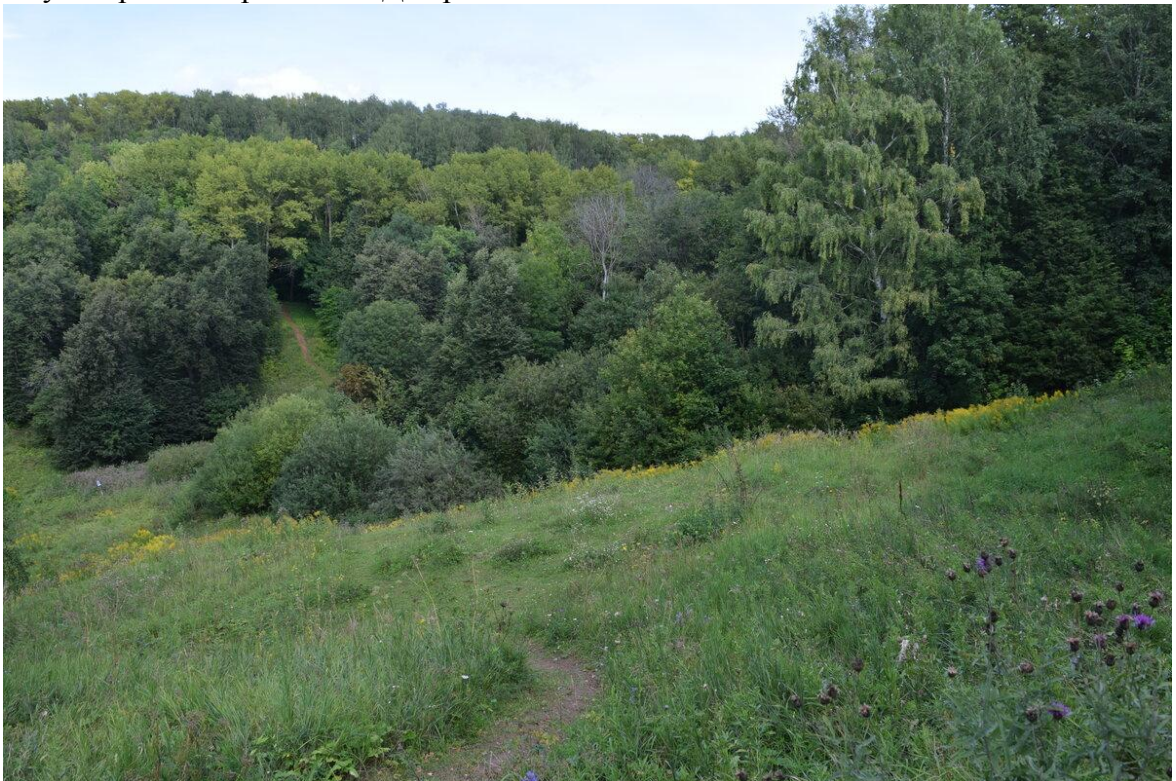
Красивые виды парка "Швейцария" в Нижнем Новгороде.

Чем дальше мы шли от ворот вглубь парка, тем тише становилось вокруг. Постепенно шум машин и разговоры людей стихли, а мы вышли к полузаброшенной бетонной лестнице, которая имела несчётное количество ступенек и вела вниз, к реке. Перепад высот здесь очень значительный, поэтому многие люди не спускаются, а просто фотографируют окрестный пейзаж - вид на другую часть Нижнего Новгорода здесь просто великолепен (на фото это видно!).