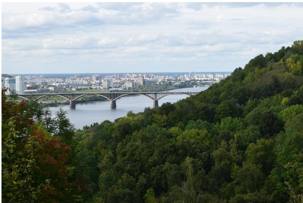
Вид на Оку и низменную часть Нижнего Новгорода из парка "Швейцария". Август 2019.

Есть в Нижнем Новгороде весьма интересный и необычный парк, который находится на правом берегу Оки, недалеко от её впадения в Волгу. Места там поистине красивые: лес, высокие холмы, перепады высот, широкая река внизу и почти полное отсутствие людей!