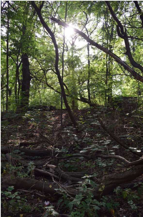
Лесная чаща в парке...