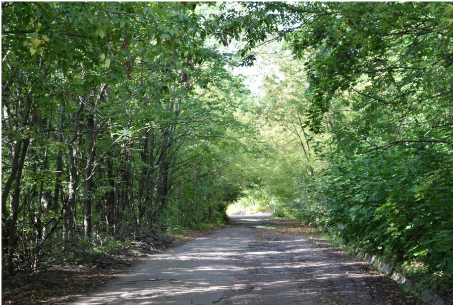
Одна из дорог в парке.