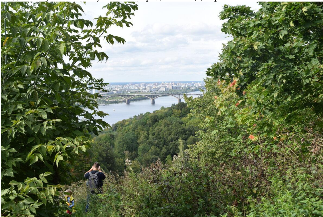
Мой друг Николай фотографирует пейзаж парка "Швейцария" в Нижнем Новгороде.

Но мы, конечно же, спустились вниз! Спускались долго, минут 15, фотографируя красивые виды. Лес здесь похож на нагорные дубравы Кавказа или склоны горы Машук в Пятигорске. Деревья растут почти под прямым углом на очень крутых склонах. Под их сенью очень густая тень, почти как в тесном и узком ущелье.