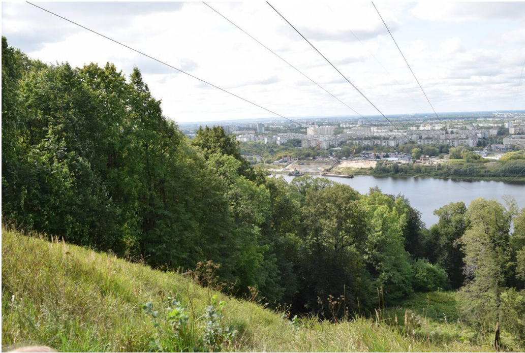
Вид на Оку и низменную часть города. Фото Д. Артюхова