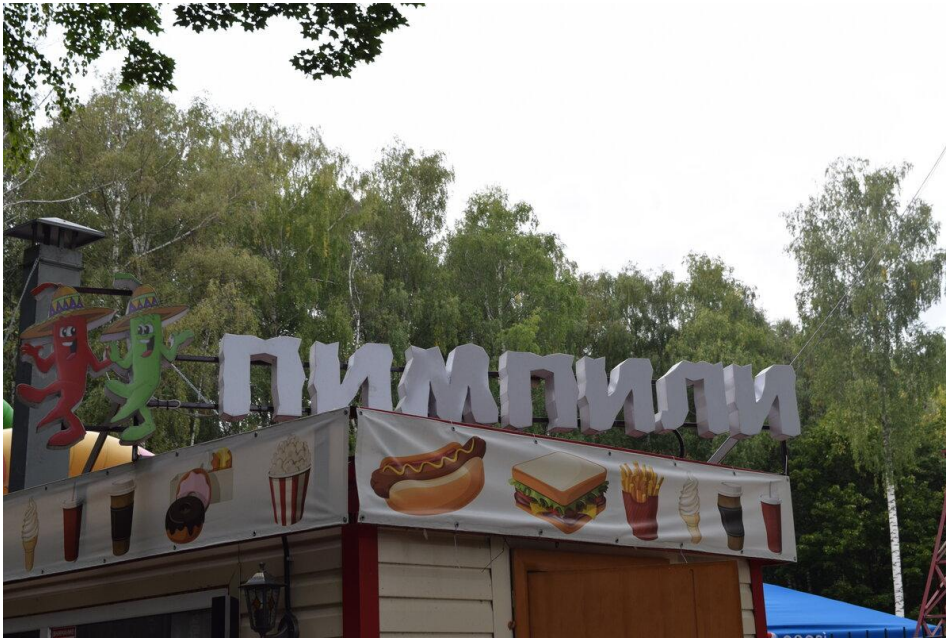
Одно из летних кафе в парке с забавным названием...