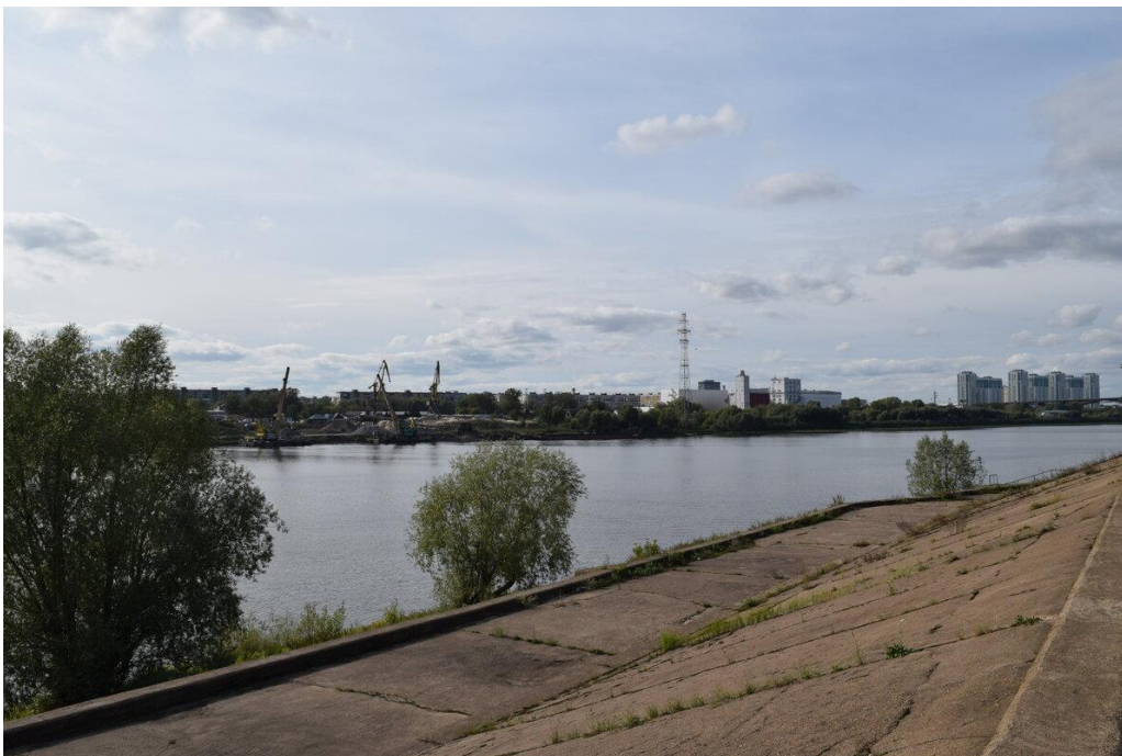
Река Ока...

ольхи, ясеня и других деревьев. Вокруг вообще ни души... Хотя день был солнечный и очень тёплый.