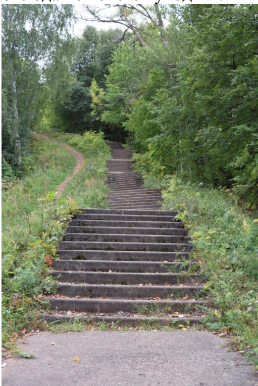
Лестница, по которой надо подняться...

На набережной Оки установлены бетонные блоки, на которых можно посидеть и понаблюдать за идущими по реке теплоходами, баржами и просто созерцать водную гладь реки. Опять же набережная здесь очень просторная, выложена бетонными плитами, людей нет, а вокруг широкая река, лес и далёкий город на другом берегу. Всё это настраивает на позитивный лад и отсюда не хочется уходить.