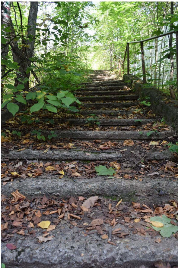
Почти заброшенная лестница (одна из...) в парке.

В парке много интересных редких растений и деревьев, например, интродуцированные с Дальнего Востока маньжурский орех и амурский бархат или красный дуб, родина которого Северная Америка. Встречается и венерин башмачок, занесённый в Красную книгу России. Возраст некоторых деревьев здесь составляет 150 лет!