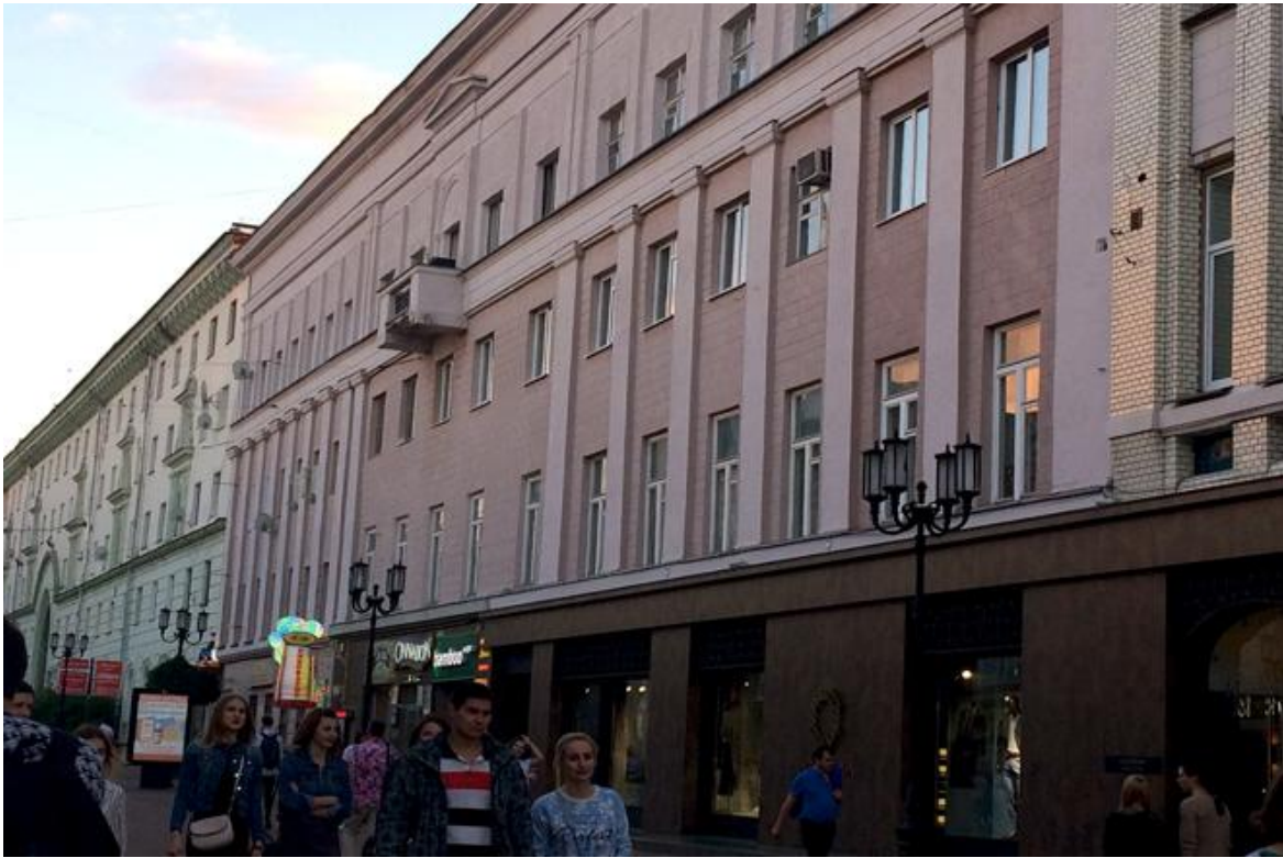
Балкон под прикрытием