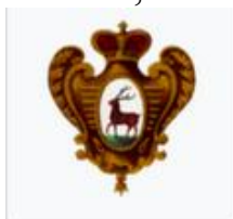
Герб Нижегородского полка (1730)

Герб Нижнего Новгорода придуман на основе исторического символа (1781). Однако, прежде чем остановиться на ныне существующем варианте, было испробовано множество версий. На данный момент некоторые элементы и символика остается спорной среди ученых. Кто-то придерживается позиции, что изначально на гербе был вовсе не олень, а лось. Другие придерживаются мнения, олень был на гербе изначально.