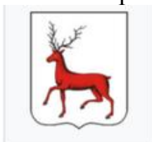
Герб столицы Нижегородского уезда — Нижнего Новгорода (1781)